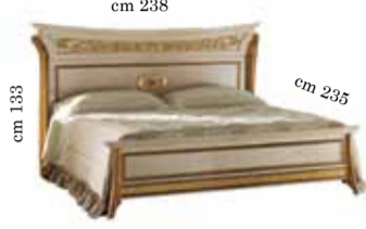
Bed art. 200 King size 180/200x200 cm Letto art. 200 King Кровать art. 200