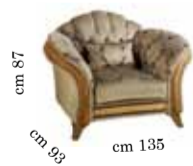
Armchair Poltrona Кресло