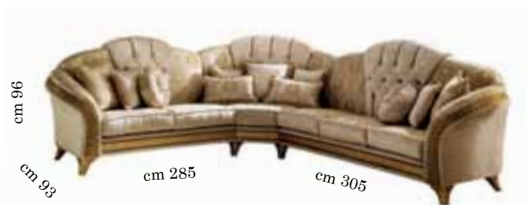
Corner Sofa (2/seats+corner+3/seats) Divano ad angolo (2/posti+angolo+3/posti) Угловой диван (2-х местный диван + Угловой элемент +3-х местный диван)

Arredoclassic Srl may introduce technical and stylistic changes to improve the production process. No complaints will be accepted if the product delivered is not exactly the same as the product photographed.