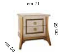
Night table Comodino Тумбочка