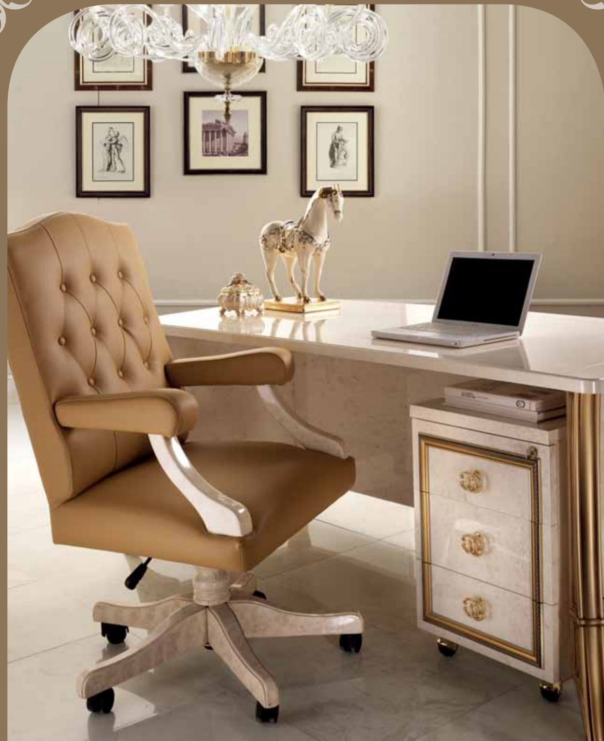
Eco Leather - Ecopelle - Эко кожа: Cat. "B" Inca Col. 9268 IC1

A real novelty is the writing desk, complete with chest of drawers and presidential armchair. This newborn creation in the Melodia Collection is dedicated to the home office, for a cozy and, in the same time, professional studio.