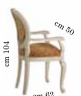
Armchair art. 200 Sedia c/braccioli art. 200 Стул с подлокотниками art. 200