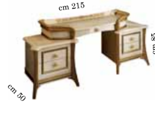
Dressing table Toilette Туалетный столик с ящиками