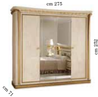
4/doors wardrobe h. 252 Armadio 4/ante h. 252 4-х дверный шкаф h. 252