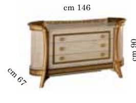
3/drawers dresser Comò 3/cassetti Комод с 3 ящиками