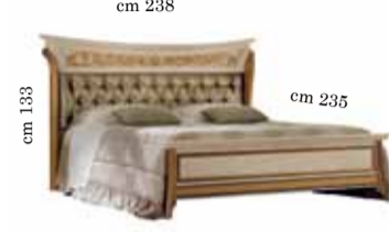
Upholstered Bed art. 201 King size 180/200x200 cm Letto imbottito art. 201 Кровать с набивным изголовьем art. 201