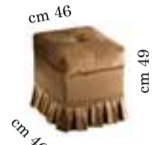
Pouf Pouf Пуф