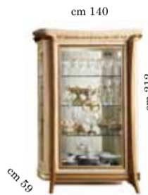
2/doors glass cabinet Vetrina 2/ante 2-х дверная витрина