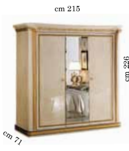
3/doors wardrobe h. 226 Armadio 3/ante h. 226 3-х дверный шкаф h. 226