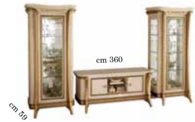
TV set composition N. 15 Composizione vetrine/TV N. 15 Стенка под тв comp.15