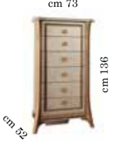
Tall chest Settimino Высокий комод