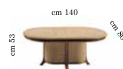
Coffee / Cocktail table Tavolo ovale salotto Журнальный столик