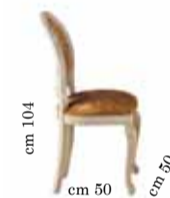
Chair art. 200 Sedia art. 200 Стул art. 200