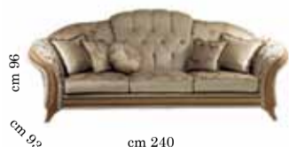
3/seats sofa Divano 3/posti 3-х местный диван