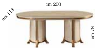
Oval fix top table Tavolo ovale fisso Овальный стол фиксированный