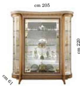
4/doors glass cabinet Vetrina 4/ante 4-х дверная витрина