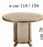
Round table with 1/extension Tavolo rotondo con 1/allungo Круглый стол раздвижной