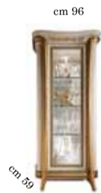
1/door glass cabinet Vetrina 1/anta Витрина однодверная