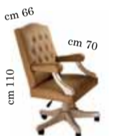
Office Armchair Poltrona Presidenziale Офисное кресло