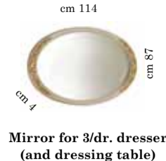
Mirror for 3/dr. dresser (and dressing table) Specchiera piccola per comò 3/cass. o toilette Зеркало для комода с 3 я. и туал. столика