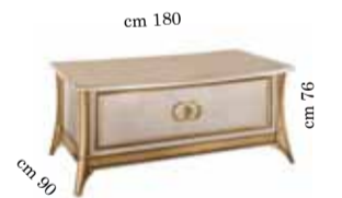
Desk Scrivanina Письменный стол