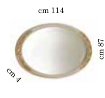
Mirror for 2/doors buffet Specchiera per contr. 2/ante Зеркало для 2 х дверного прилавка