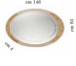
Large mirror for dressing table Specchiera grande per toilette Зеркало для туал. столика