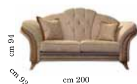
2/seats sofa Divano 2/posti 2-х местный диван