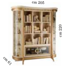
Bookcase Libreria Библиотека