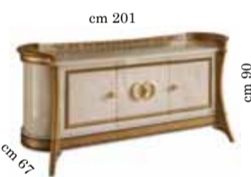
3/doors buffet Contromobile 3/ante 3-х дверный прилавок