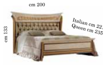
Upholstered Bed art. 201 Queen or Italian size 160x190/200 cm Letto imbottito art. 201 Кровать с набивным изголовьем art. 201