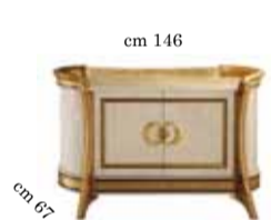
2/doors buffet Contromobile 2/ante 2-х дверный прилавок