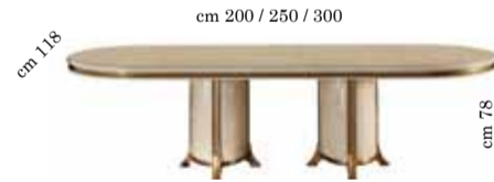
Oval table with 2/extensions Tavolo ovale con 2/allunghi Овальный стол раздвижной с 2 вставками