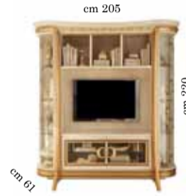
TV Wall unit comp. N. 20 Mobile TV comp. 20 Стенка под тв comp.20