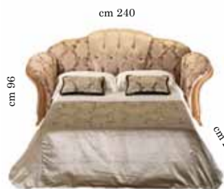
3/seats sofa with bed Divano 3/posti con letto 3-х местный диван с раскладным механизмом