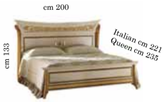
Bed art. 200 Queen or Italian size 160x190/200 cm Letto art. 200 Кровать art. 200