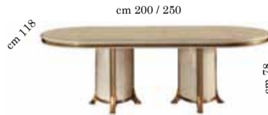
Oval table with 1/extension Tavolo ovale con 1/allungo Овальный стол раздвижной с 1 вставкой