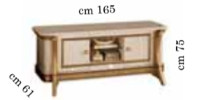
TV cabinet Art. 200 Mobile porta TV Art. 200 Тумба под тв Art. 200